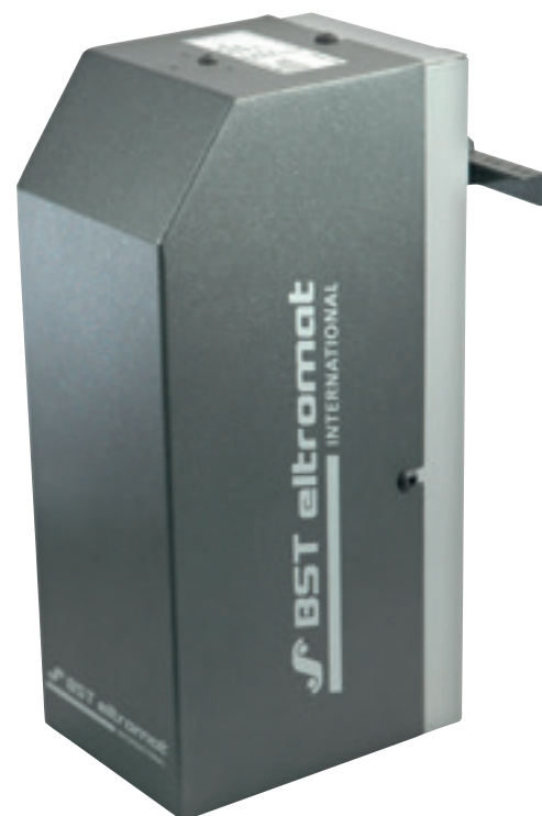
Unidad de Cámara

Así como sus exitosos antecesores, el nuevo POWERScope 5000 cumple el criterio establecido: excelente precio, operación simple, robustez y fiabilidad.