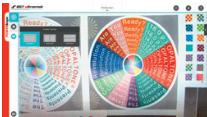
La intuitiva interfaz de la pantalla táctil POWERScope 5000 "Menú de configuración de la pantalla de producción"

El POWERScope 5000 es totalmente compatible mecánicamente con los sistemas antecesores POWERScope 3000 y POWERScope 4000 sin la necesidad de cualquier modificación en la estructura de la máquina.